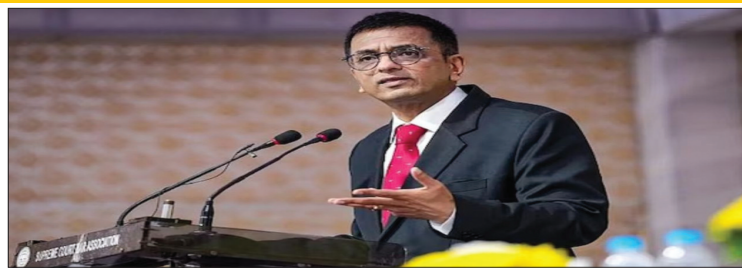
और ज्यूडिशियरी में बंदी

सवालों पर सीजेआई ने कहा- लोगों को यह समझना चाहिए कि जजों पर काम का बहुत बोझ है। उन्हें सोचने-विचारने का भी समय चाहिए होता है, क्योंकि उनके फैसले समाज का भविष्य तय करते हैं। मैं खुद रात 3-30 बजे उठता हूँ और सुबह 6:00 बजे से अपना काम शुरू कर देता हूँ। अमेरिकी सुप्रीम कोर्ट एक साल में 181 केस निपटता है। जबकि भारतीय सुप्रीम कोर्ट में इनके केस तो एक ही दिन में निपटारे जाते हैं। हमारा सुप्रीम कोर्ट हर साल 50,000 केस निपटता है।