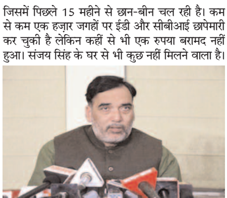
जिसमें पिछले 15 महीने से छान-बीन चल रही है। कम से कम एक हजार जगहों पर ईडी और सीबीआई छापेमारी कर चुकी है लेकिन कहीं से भी एक रुपया बरामद नहीं हुआ। संजय सिंह के घर से भी कुछ नहीं मिलने वाला है।

नयी दिल्ली। आम आदमी पार्टी (आप) के वरिष्ठ नेता और दिल्ली के पर्यावरण मंत्री गोपाल राय ने कहा कि भारतीय जनता पार्टी (भाजपा) को आने वाले चुनावों में हार मिलने वाली है इसलिए प्रधानमंत्री नरेंद्र मोदी बौखलाएट में संजय सिंह के घर छापेमारी करवा रहे हैं। श्री गोपाल राय ने आज कहा कि संजय सिंह के घर प्रवर्तन निदेशालय (ईडी) की छापेमारी इसलिए हो रही है कि इस देश के हर सर्वे में बताया जा रहा है कि आगामी चुनावों में भाजपा हार रही है। उन्होंने कहा कि श्री मोदी इसी बौखलाएट में कार्रवाई करवा रहे हैं। उन्होंने कहा कि पिछले डेढ़ साल में इस मामले को लेकर एक हजार जगहों पर छापेमारी की गई। ईडी और केन्द्रीय जांच ब्यूरो (सीबीआई) ने बहुत लोगों को गिरफ्तार किया और उनको प्रताड़ित किया लेकिन आज तक किसी के पास से एक चक्करो नहीं मिली। उन्होंने कहा कि संजय सिंह के घर से भी कुछ नहीं मिलने वाला है।