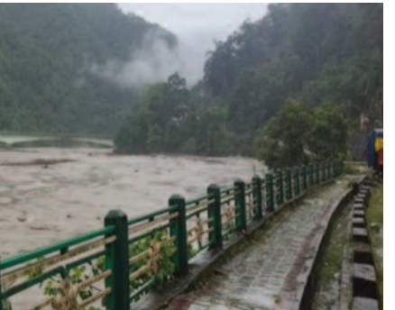
निचले इलाकों को खाली कराना शुरू कर दिया गया। गंगटोक में भारत मौसम विज्ञान विभाग के क्षेत्रीय कार्यालय के एक अधिकारी ने कहा, जब किसी छोटे क्षेत्र में लगभग एक घंटे में 100 मिमी से अधिक बारिश होती है, तो इसे बाढ़ फटना कहा जाता है। अधिकारियों ने

एवं बचाव अभियान जारी है। अधिकारियों ने कहा कि तीस्ता नदी में जल स्तर अचानक बढ़ने के बाद मंगलवार देर रात उत्तरी सिक्किम में कम से कम छह पुल बह गए। उन्होंने यह भी कहा कि तीस्ता नदी में जलस्तर अचानक बढ़ने की खबर मिलते ही अलर्ट जारी कर दिया गया और नदी के किनारे