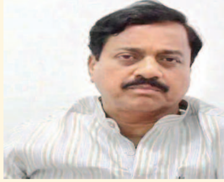
कि आज एक अलग स्थिति में महाराष्ट्र में आरक्षण को लेकर एक तरह के असंतोष की तस्वीर बन रही है। उन्होंने कहा कि महाराष्ट्र में कुल मिलाकर माहौल यह है कि उन्हें आरक्षण मिलना चाहिए, लेकिन

मुंबई। महाराष्ट्र में राष्ट्रवादी कांग्रेस पार्टी (राकांपा) (अजित पवार गुट) के अध्यक्ष और सांसद सुनील तटकरे ने स्पष्ट किया कि मराठा समुदाय के लिए आरक्षण पर उनकी पार्टी की स्थिति अपरिवर्तित रहेगी। उन्होंने कहा कि अन्य पिछड़ा वर्ग (ओबीसी) के आरक्षण को खतरे में डाले बिना मराठों को आरक्षण दिया जाना चाहिए। श्री तटकरे ने कहा कि वह सरकार से बिहार की तर्ज पर जातिवार जनगणना कराने की मांग करेंगे। उन्होंने कहा, ऐसा नहीं है कि मराठा समुदाय के सदस्य केवल आज ही आरक्षण की मांग को लेकर आंदोलन कर रहे हैं। वास्तव में, आज सभी समुदाय आरक्षण की मांग कर रहे हैं। उन्होंने यह भी कहा