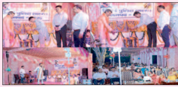
संस्कार उजाला, तेजवीर सिंह

हापुड़। गुरुवार को जन अष्टमी के शुभ अवसर पर जगह जगह मंदिरों में सजावट हुई कई जगह कान्हा श्याम के जागरण सांस्कृतिक प्रोग्राम भी चले वहीं पक्का बाग स्थित गौशाला पर मंच कार्यक्रम व बच्चों के खेल कूद करने के लिए छोटे छोटे घरख झूले और महिलाओं की खरीददारी की दुकाने भी लगी बताते हैं पुलिस लाइन में भी जन अष्टमी मनाई गई जहाँ हापुड़ जिलाधिकारी महोदय एवं श्रीमान पुलिस अधीक्षक महोदय द्वारा दीप प्रज्वलित कर पूजा अर्चना की गई व सांस्कृतिक कार्यक्रमों का आयोजन भी कराया गया इस अवसर पर श्रीमान अपर पुलिस अधीक्षक महोदय एवं पुलिस परिवार जन भी उपस्थित रहे।